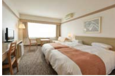
デラックスツイン(30㎡) 定員2~4名