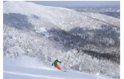
十勝平野が広がる全コース、道東1のスキー場