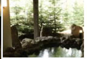
露天風呂(麦飯石の湯)