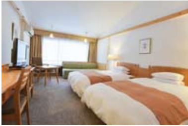
スタンダードツイン(26㎡) 定員2名

ゲストルーム 全165室(北館64室 南館101室) Wifi全館完備 長期滞在も快適。ゆったりサイズの2タイプ(全室禁煙)