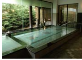
主浴槽・ジェットスパ