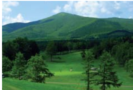
高原の風が吹き抜ける 18H、6928Yのリゾートゴルフ