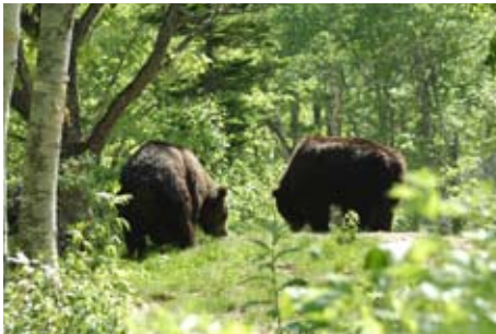
サホロの森に暮らす雄大なヒグマを間近で観察