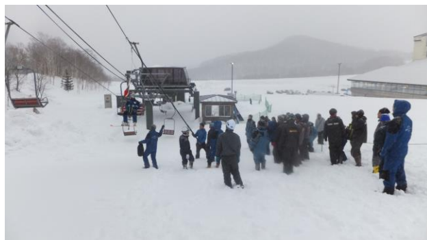
救助訓練（第7リフト）